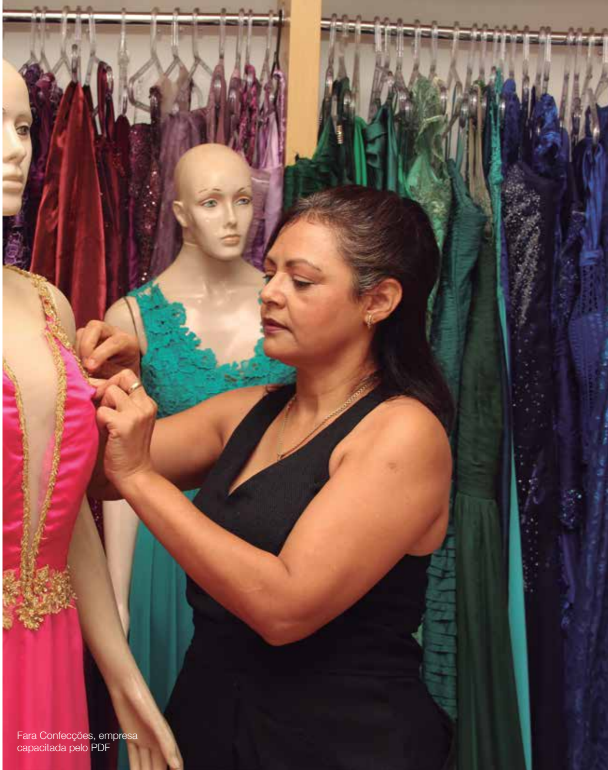
Fara Confeções, empresa capacitada pelo PDF