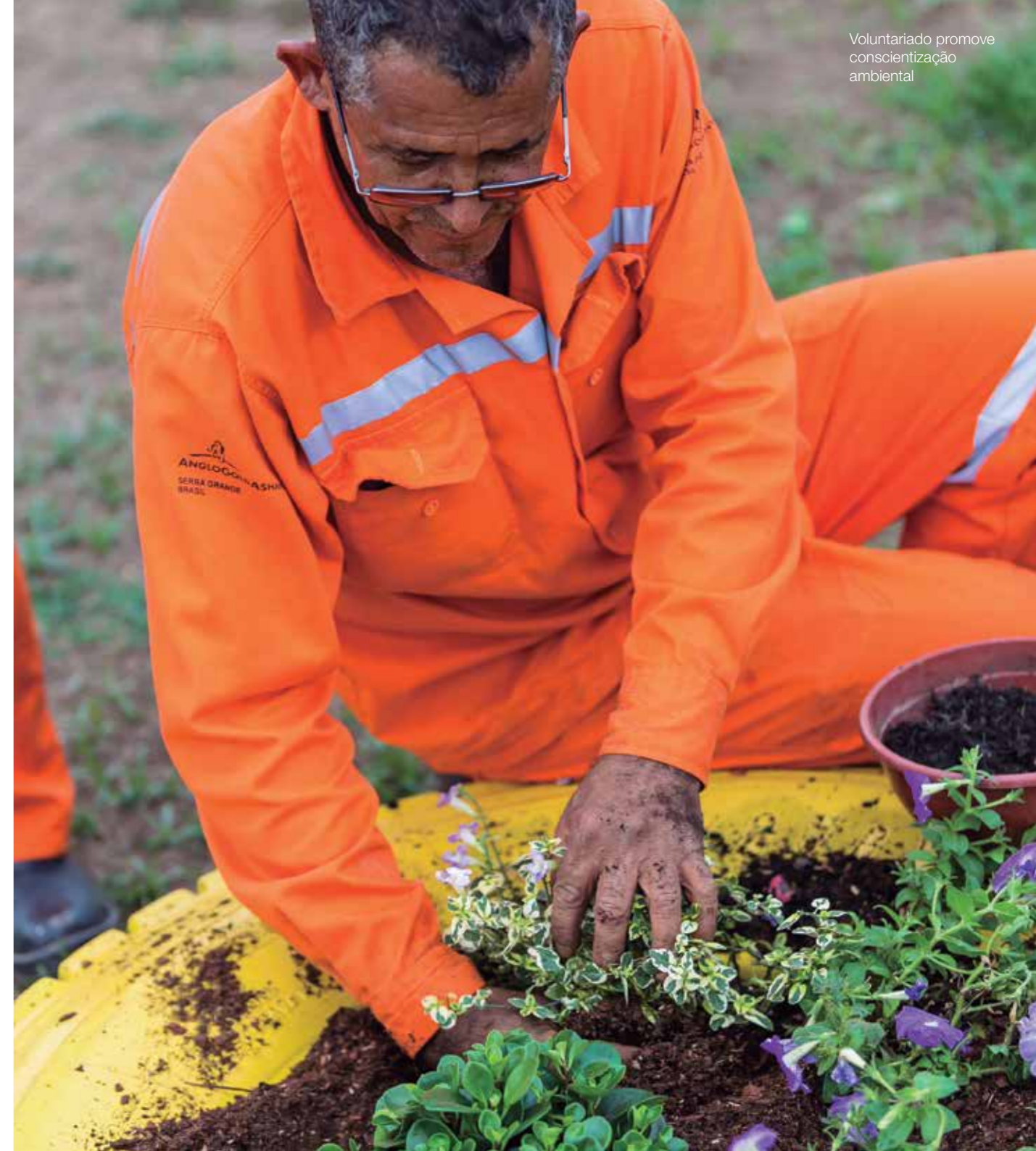
Voluntariado promove conscientização ambiental

A AngloGold Ashanti investe em uma série de ações focadas na educação ambiental, incentivando empregados, comunidades escolares e moradores a adotarem uma conduta de respeito ao meio ambiente.