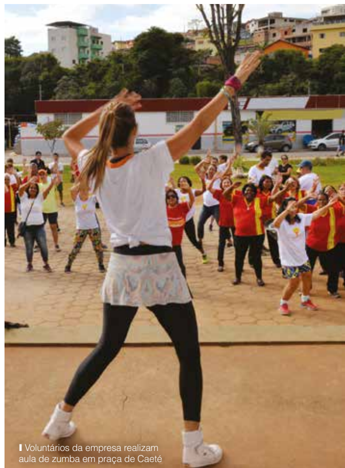
Voluntários da empresa realizam aula de zumba em praça de Caeté

Em dezembro de 2017, Caeté sofreu com as fortes chuvas que atingiram a cidade. Com o intuito de ajudar as vítimas, 100 voluntários da empresa arrecadaram centenas de itens de higiene, roupa de cama e alimentos, que foram doados para asilos, instituições que acolhem crianças em situação de vulnerabilidade social e moradores da comunidade, beneficiando 220 pessoas.